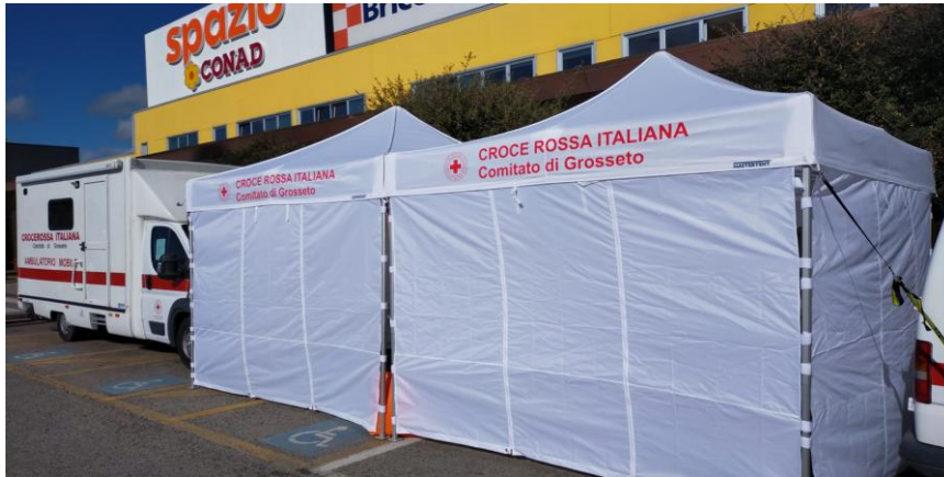
Postazione tamponi AURELIA ANTICA