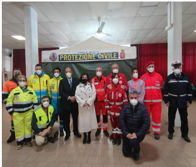
Postazione tamponi cittadini Ucraini 25 marzo